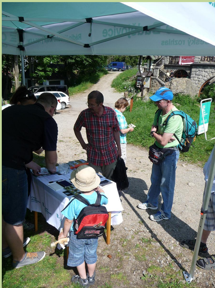
Stanoviště pořadatelů - nejmladší účastník