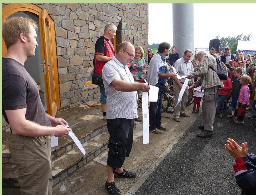
Slavnostní otevření rozhledny