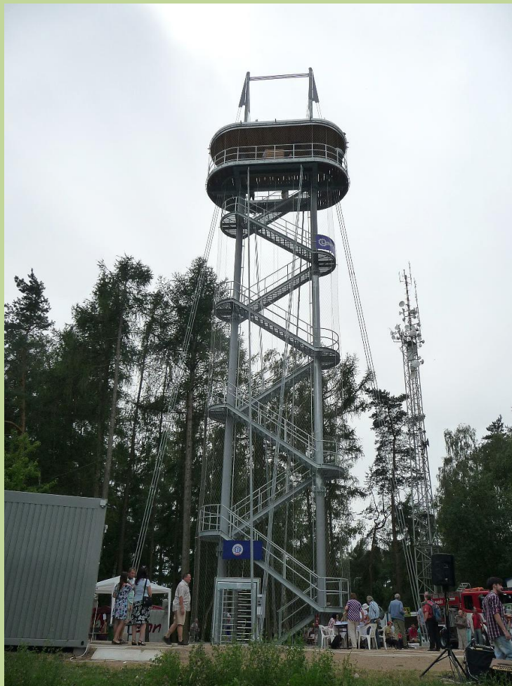
Nová rozhledna Hýlačka