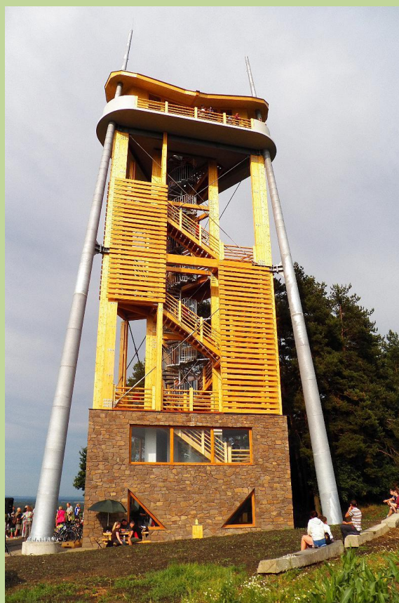
rozhledna Rýdův kopec