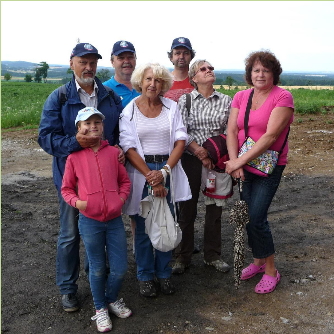
Účastníci z KČT Jindřichův Hradec a Českých Budějovic

předseda oblastního výboru KČT Jižní Čechy