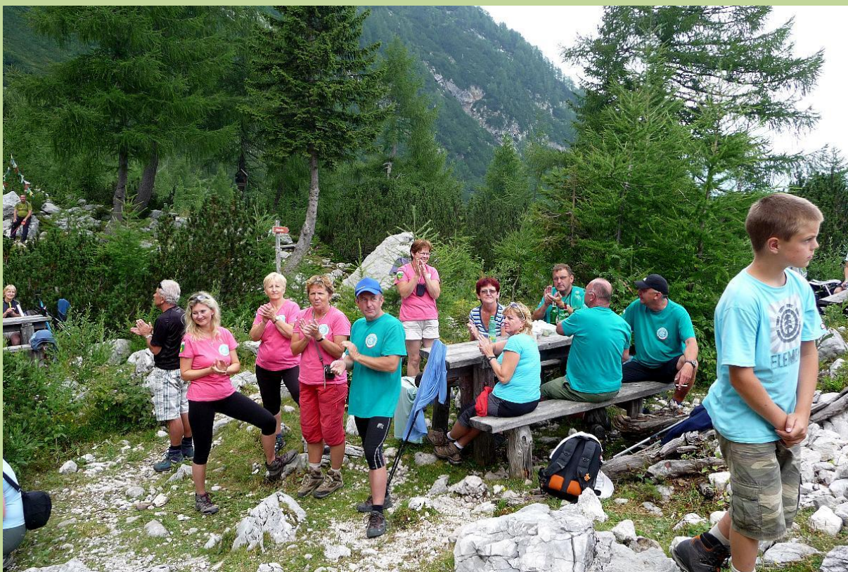
Účastníci – turisté z ČR