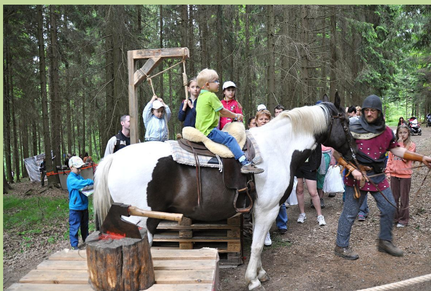
Pohádkový les – stanoviště doba husitská