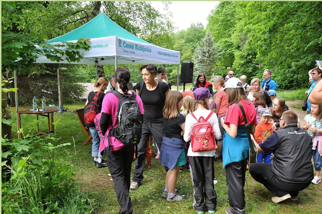
Stanoviště Českého rozhlasu České Budějovice