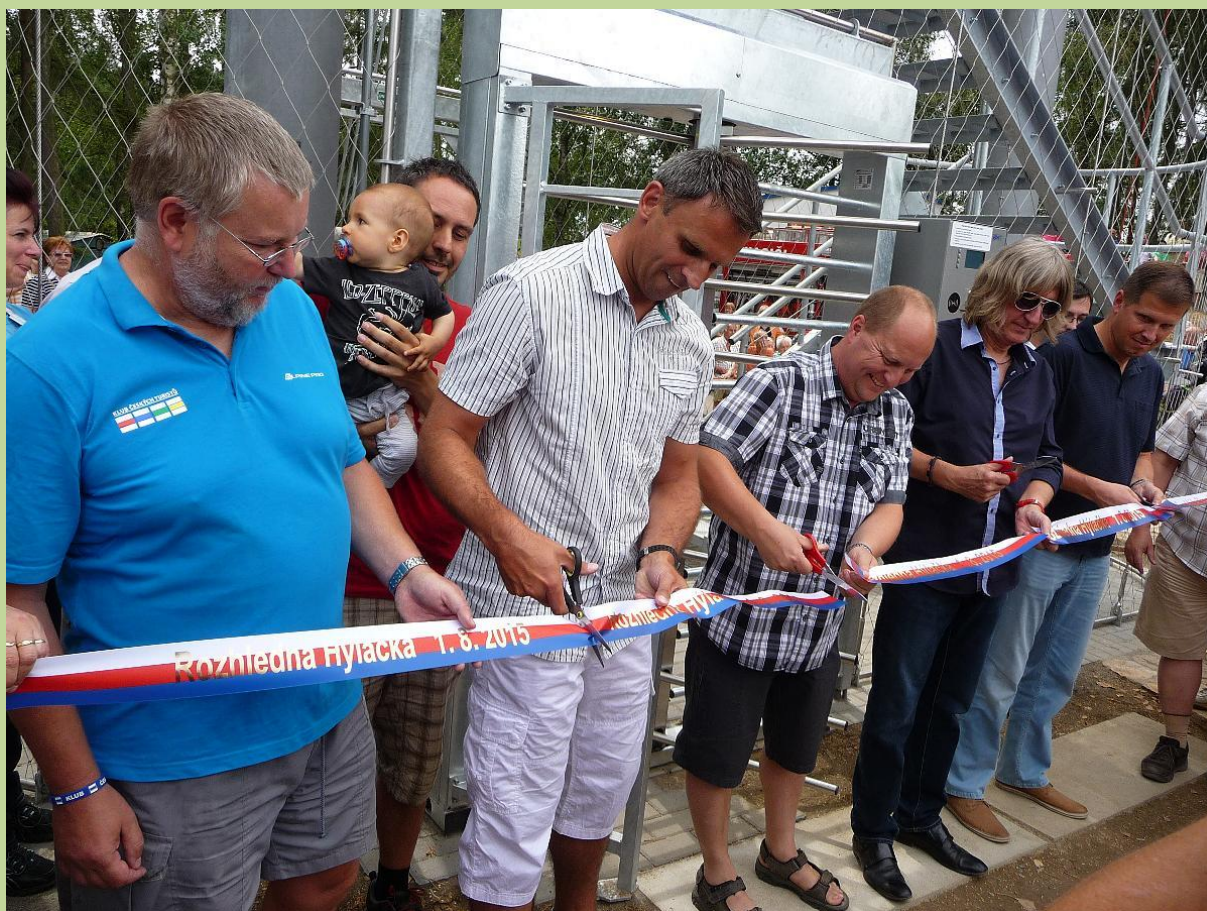
Slavnostní otevření rozhledny – z leva zástupce UV KČT, hejtman Jihočeského kraje, předseda KČT Tábor, starosta města Tábora, zástupce stavební firmy.

Účastníci akce obdrželi pamětní list, mohli získat nové razítko rozhledny a vystoupat jako první na novou rozhlednu. Za první den této možnosti využilo přes 500 zájemců, ke konci září (za první dva měsíce) již přes 10 tisíc.