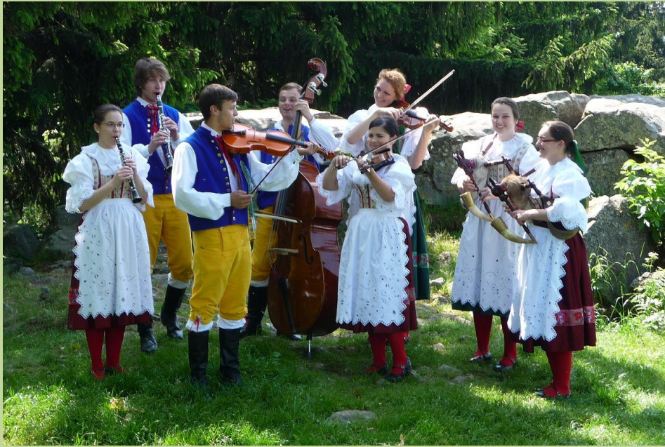
O dobrou náladu se staral dětský folklorní soubor