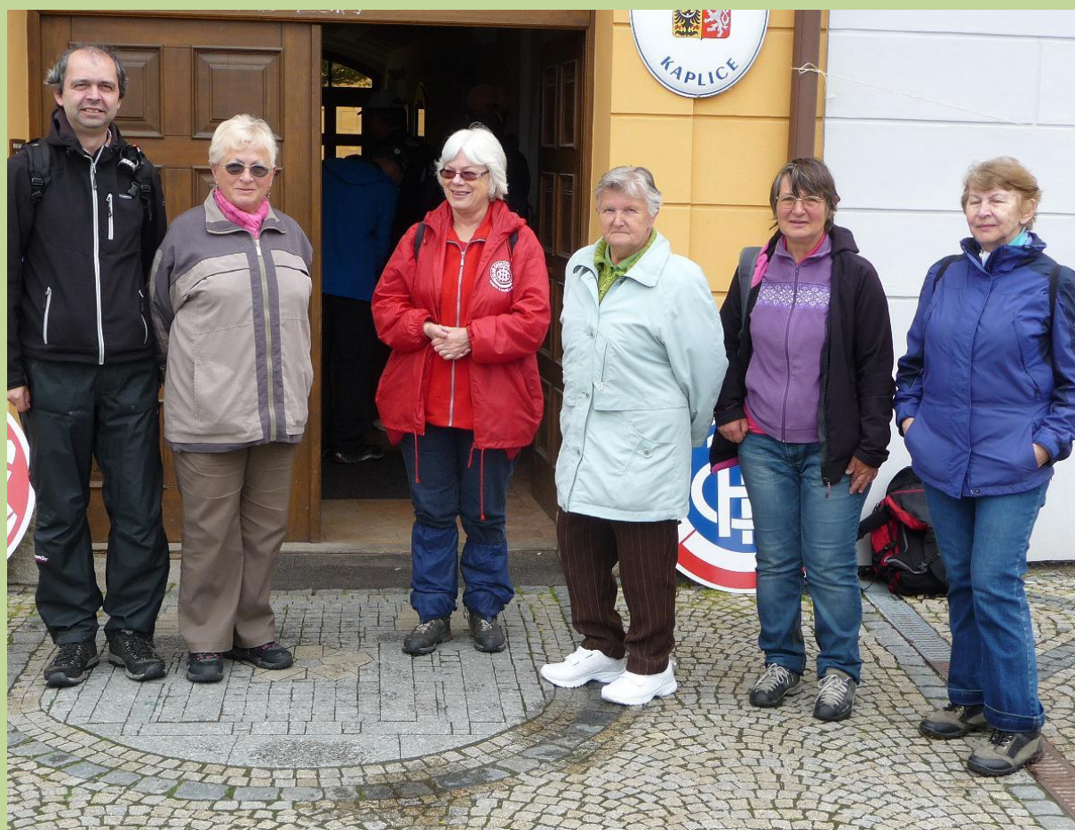
Účastníci a pořadatelé v cíli – na náměstí v Kaplici