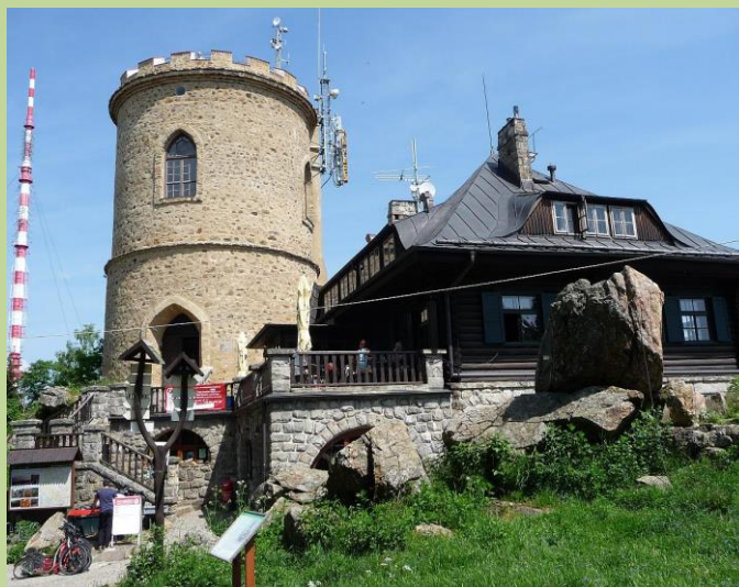
Chata Klet' s rozhlednou, v pozadí rozhlasový a televizní vysílač