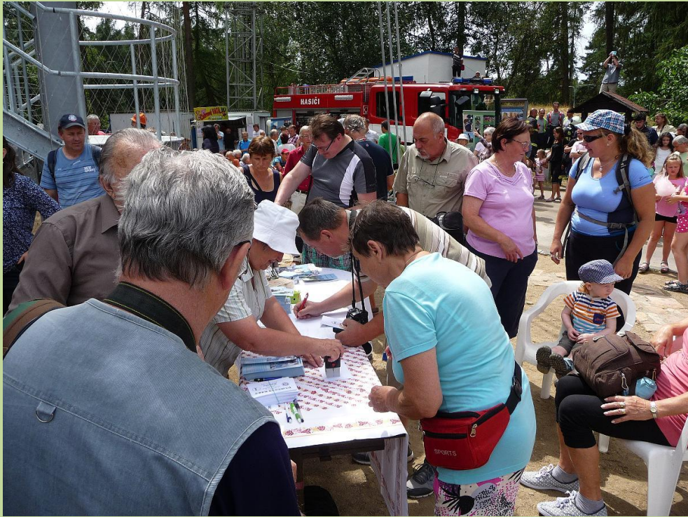
Účastníci otevření rozhledny