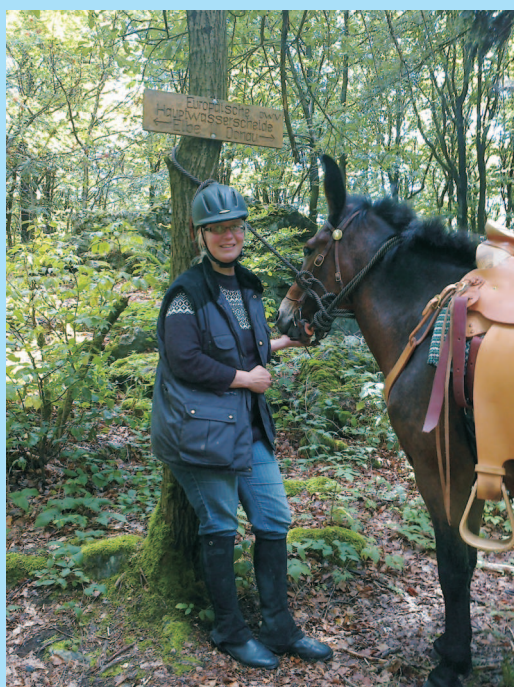
Na "střeše světa" - rozvodí Severního a Černého moře