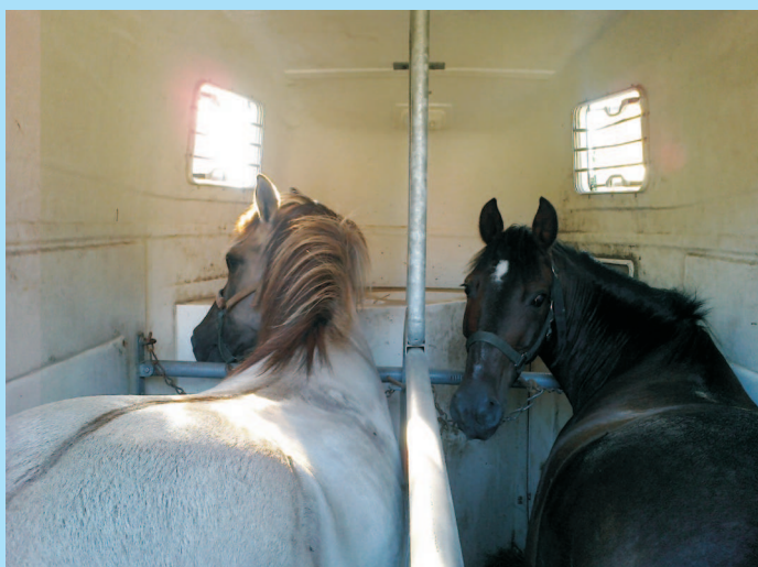
Už se těšíme ven ...