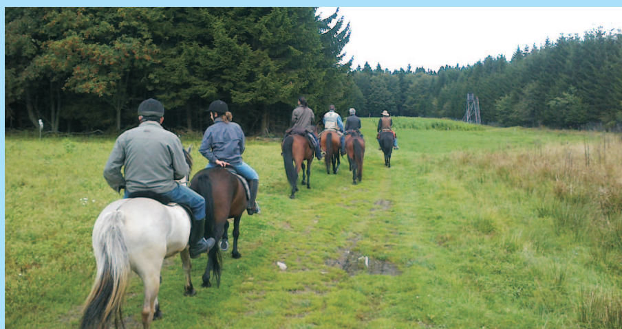
Putování v německém pohraničí