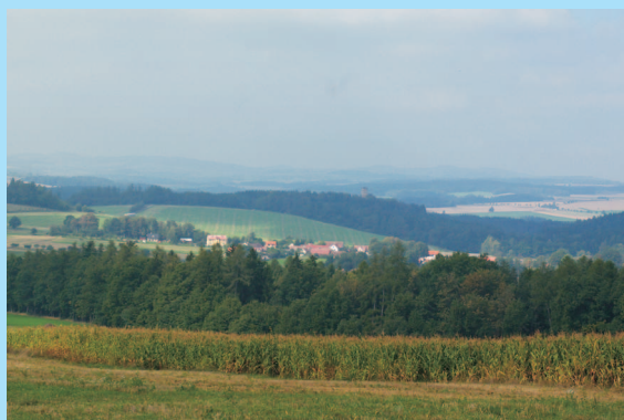
Pohled od Staniměřic k Šelmberku