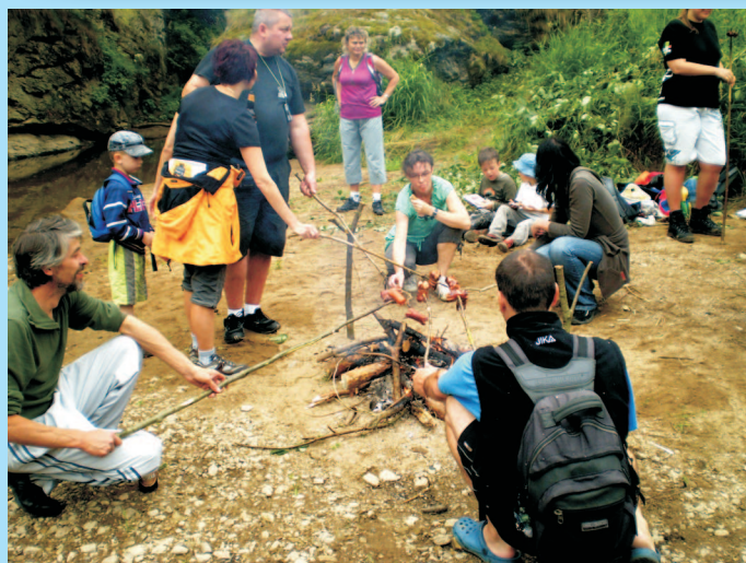
V cíli akce