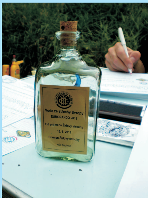
Láhev pro odběr