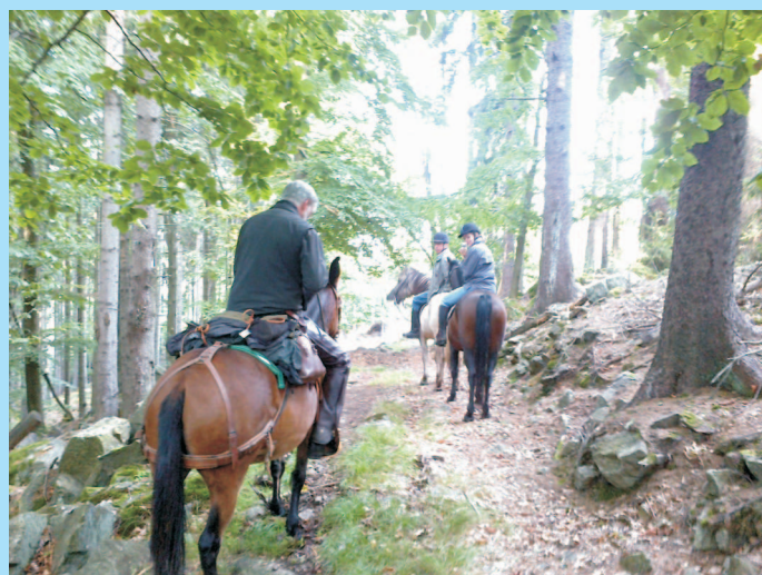
Po stopách středověké obchodní cesty