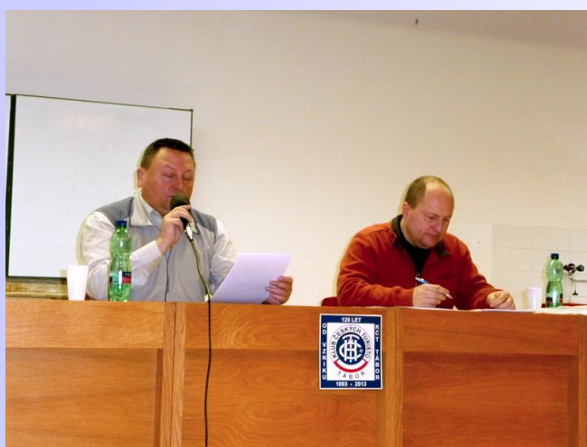
Pohled na předsednický stůl