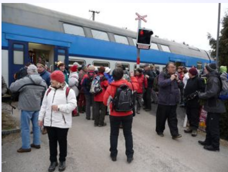
Na startu v Třísově