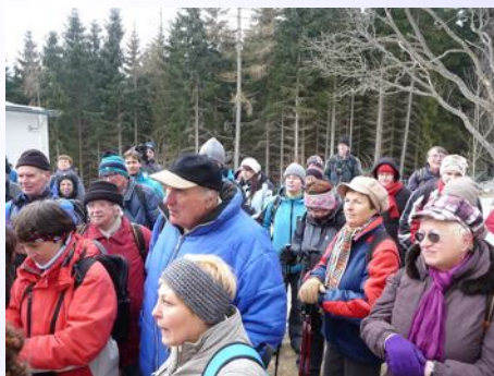
Na vrcholu Kleti - čekání na křtění planetek