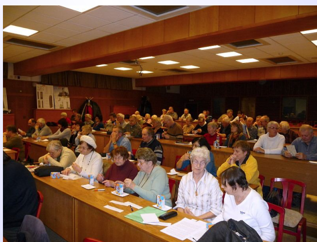
Pohled do jednacího sálu