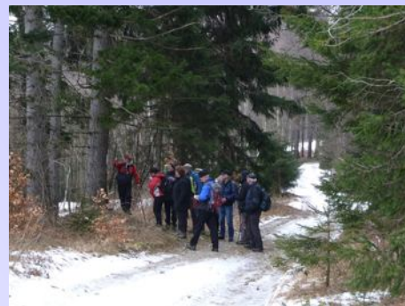
Na trase pochodu - plnění sazky