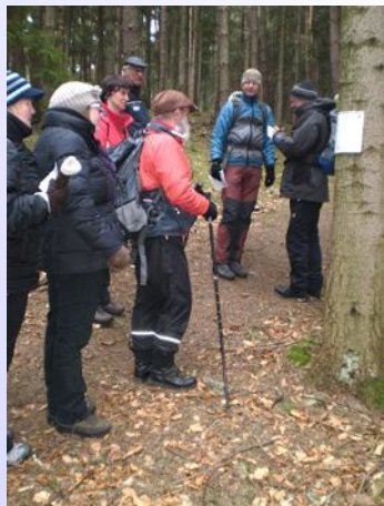
Na trase pochodu - plnění sazky