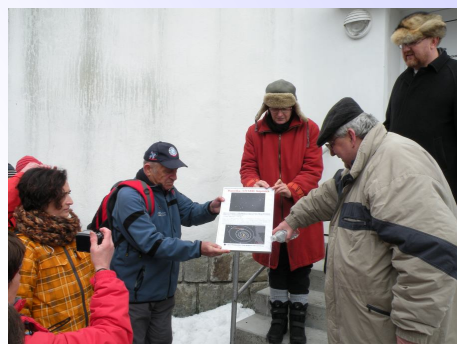
Křtění planetek Emanuelfritsch a Náprstek