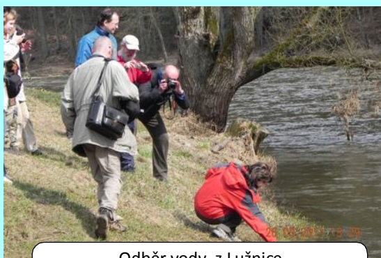
Odběr vody z Lužnice