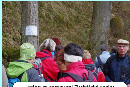
Jedno ze zastavení Turistické sazky