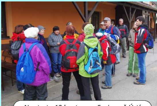
Na startu 13 km trasy v Sezimově Ústí