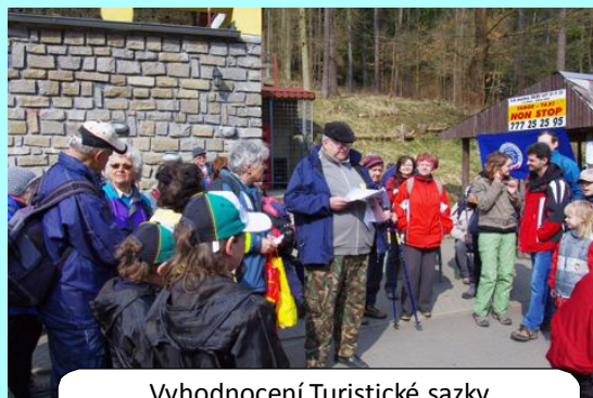
Vyhodnocení Turistické sazky