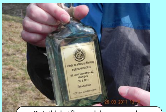
Detail lahvičky s odebranou vodou