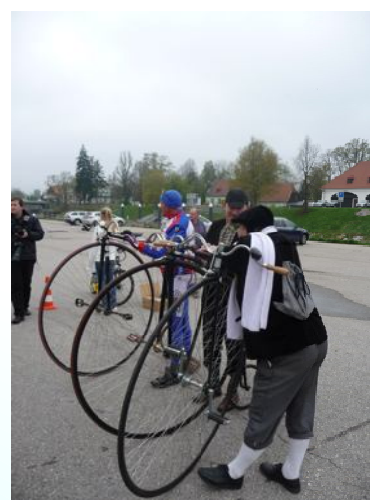
Zahájení cyklosezóny a otevření nové cyklostezky

Zpravodaj je vydáván 4 x ročně, pouze v elektronické podobě ve formátu pdf.