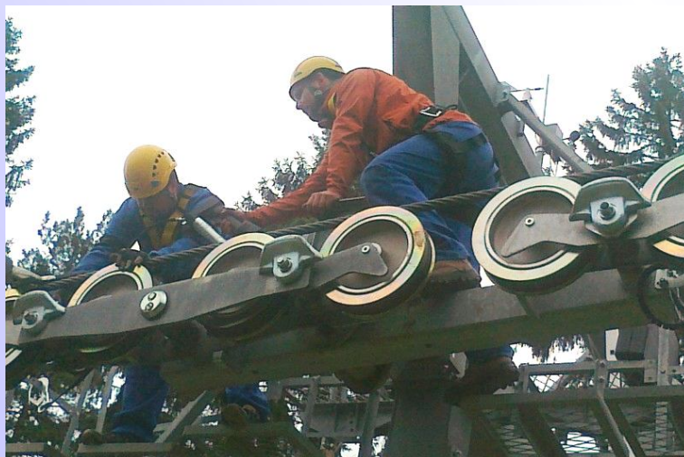
Pracovníci provádějí práce na jedné z lanovek Skiareálu Lipno

Ještě než se ztelněji ochladí a přijde první sníh, snaží se v Lipně nad Vltavou pomocí různých speciálních nabídek o zpestření podzimu. „Návštěvníkům nabízíme různé balíčky zvýhodněných služeb, které obsahují pobyty na Lipně a další služby, spojené s výběrem z kulturních a sportovních specializovaných programů. Naším cílem je turisty na Lipensko přilákat i na podzim, kdy je zde také velice krásně,“ doplnil Falout.