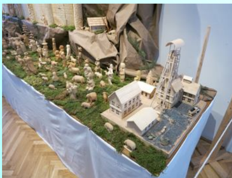
Jeden z vystavovaných betlémů

10 turistů včetně vedoucího ušlo celkem 14 km. Vedoucí cestou odvolil 6 geokešů. Bylo polojasno, mráz kolem -5°C, silný ledový vítr, na Svaté Hoře chvilku zasvitlo ledové sluníčko. Na pěšinách bylo bláto umrzlé i roztáté, na kratších zastíněných úsecích sem tam i led, ale naštěstí to příliš neklouzalo. Strávili jsme příjemný sváteční den.