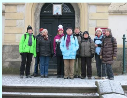
Účastníci výletu za příbramskými betlémy