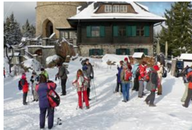
Zimní výstup na Klet'