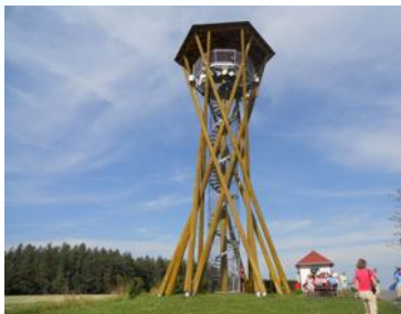
U rozhl. Borůvka v Žel. horách