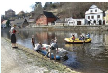
Splouvání Vltavy na raftech