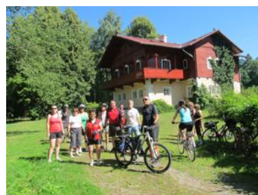
Třeboňskem na kole