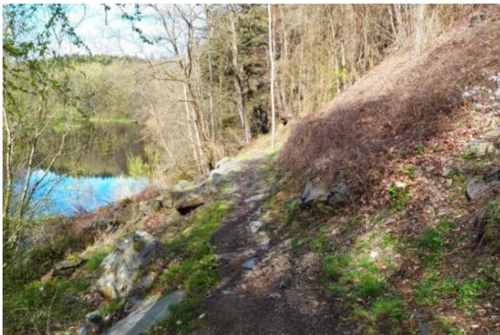
Stezka okolo Vltavy