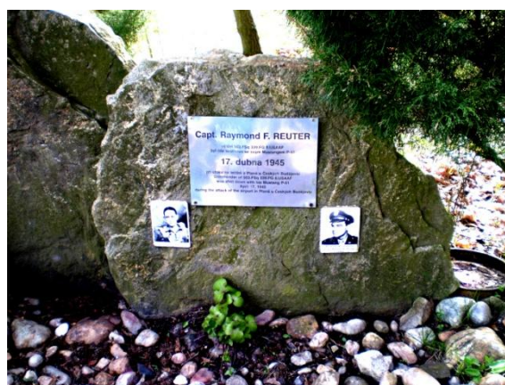
Pomník amerického pilota