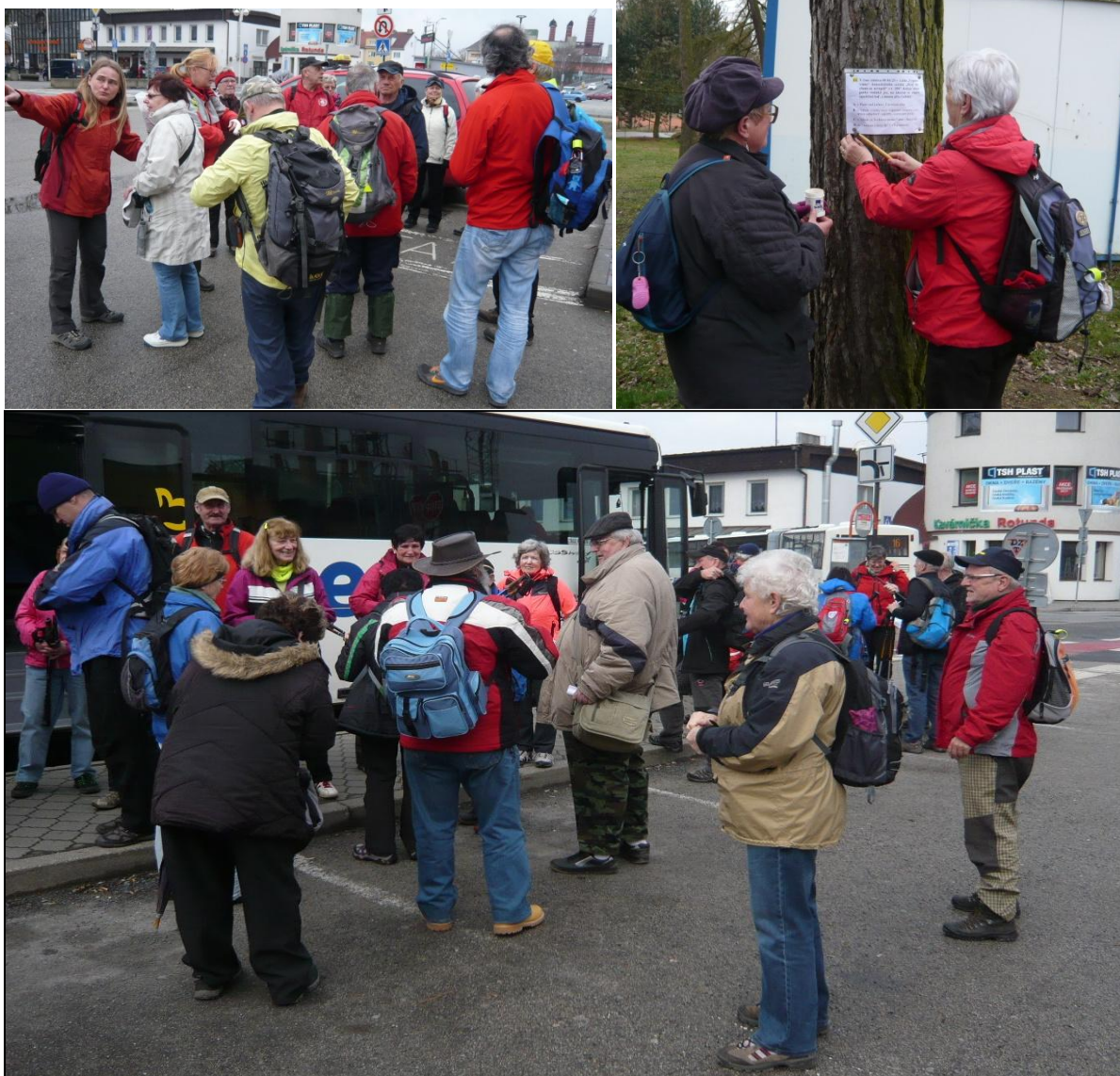
Jarní kilometry v Táboře