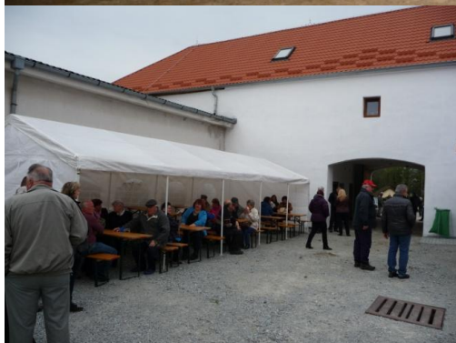
otevření muzea v obci Kamenná