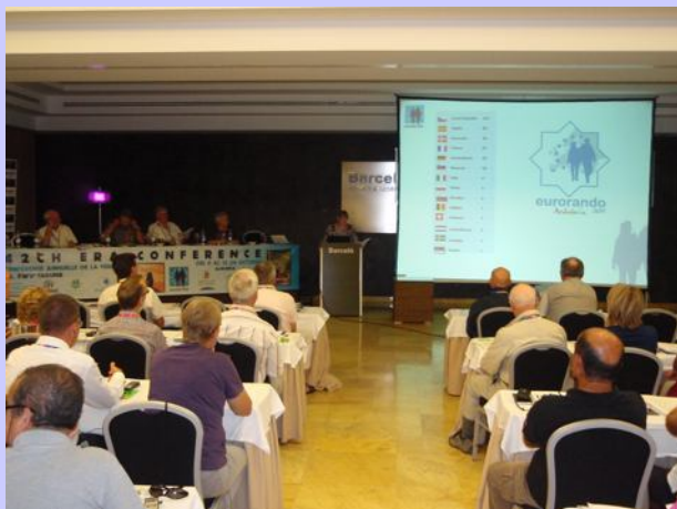
Konference v Almerii