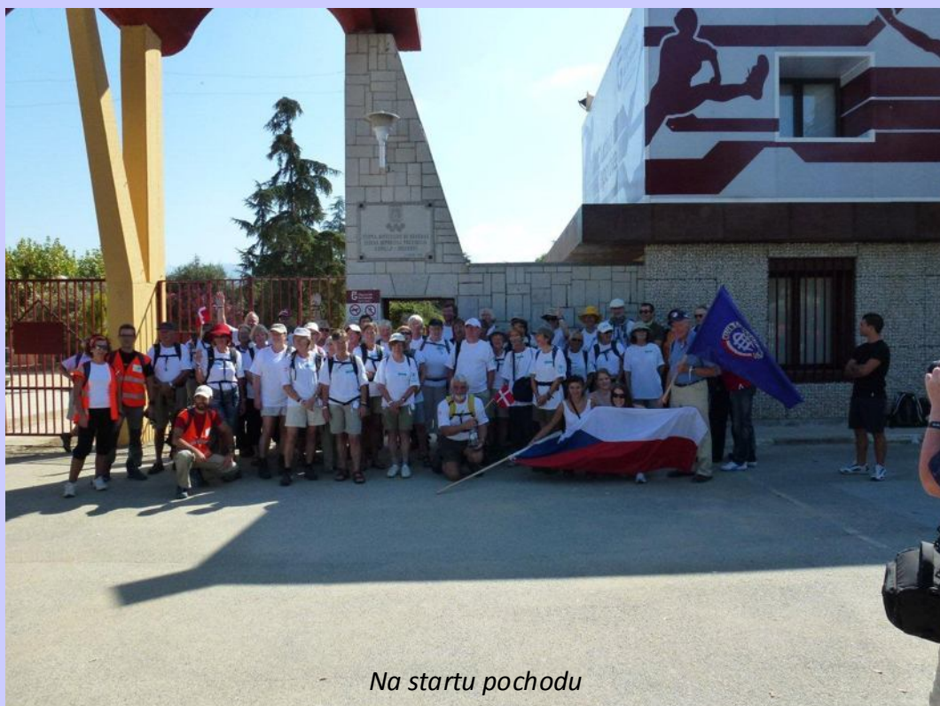
Na startu pochodu