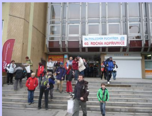
Na startu pochodu

V letošním roce se Poslední puchýř uskuteční v Plzni v termínu 16. - 18. listopadu.