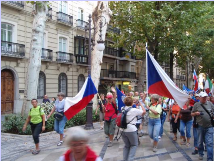
Karlovarští turisté v průvodu