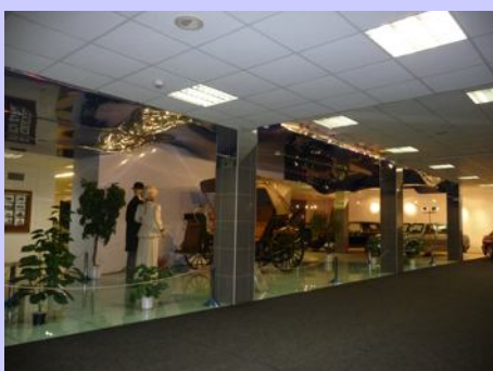
Muzeum Tatry v Kopřivnici