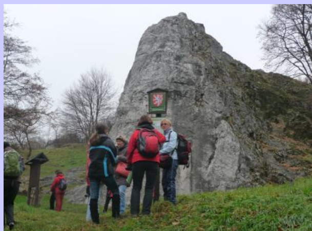
Na trase pochodu