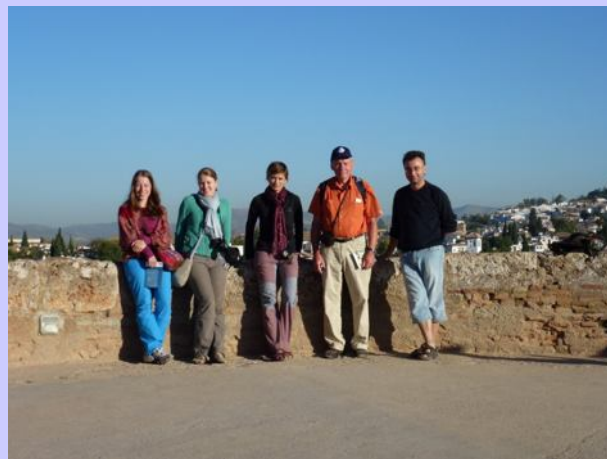
Delegace Klubu českých turistů