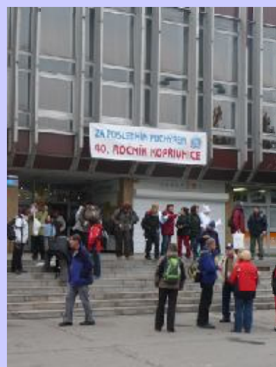
Na startu pochodu