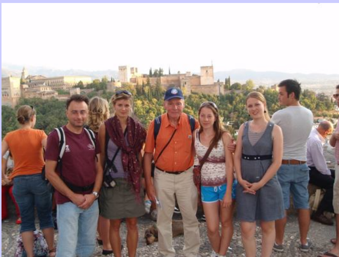
Účastníci a pohled na Alhambru