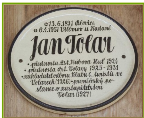
Pamětní deska na nádraží ve Volarech