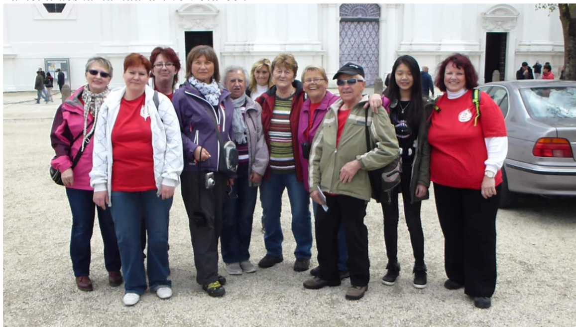
Foto z činnosti KČT Volary