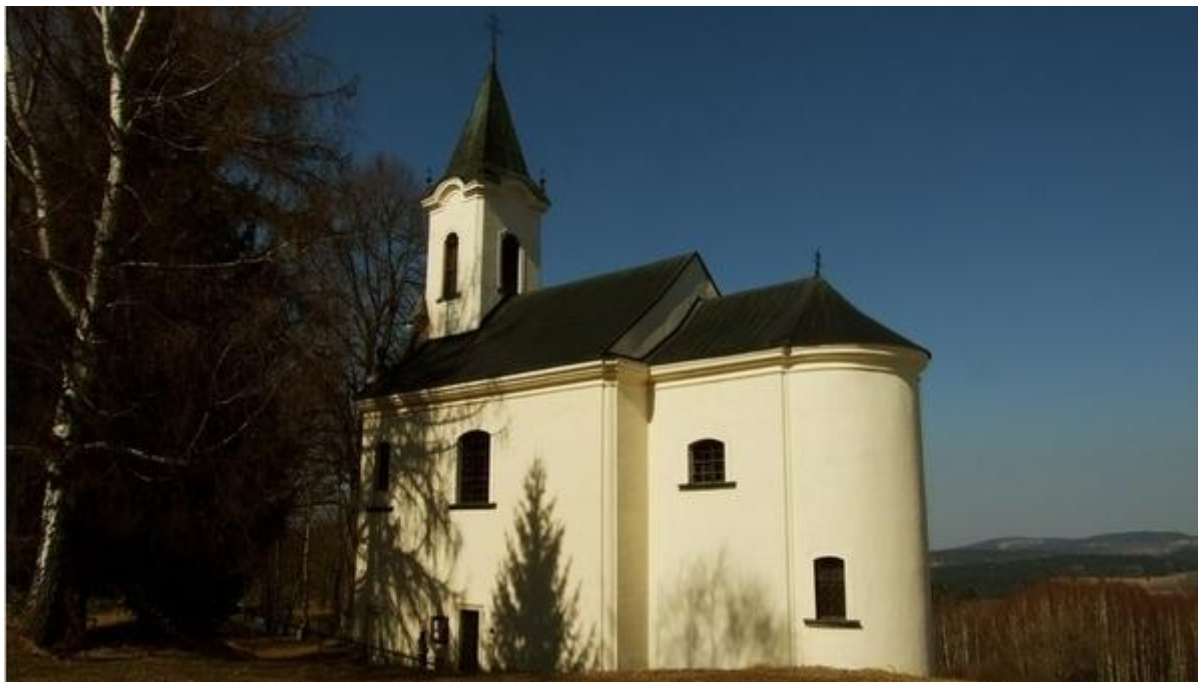
kostel sv. Máří Magdalény

Nedaleko Volar na stráni pod lesem stojí jeden z drobných klenotů barokní architektury, ideálně spjatý s šumavskou přírodou, ba i tajemným děním i výskytem pohádkové bytosti v pověstech zmiňovaný. Jako mnoho jiných povstal z popela ohně lhostejnosti a vandalismu nedávných let a opět zdobí krajinu.