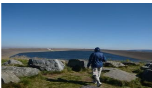
Jeseníky - Dlouhé stráně