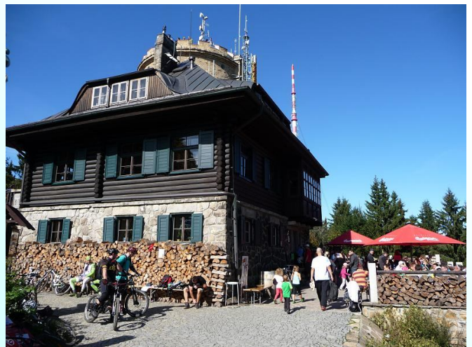
Chata na Kleti