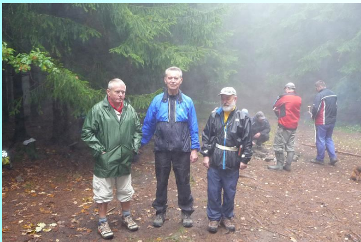
Výstup na Kluk

Na rozdíl od předchozí akce Výstup na Kluk, kdy bylo ošklivé počasí, se tentokrát vše vydařilo. Vrchol byl v obležení turistů, kteří ať již pěšky či na kole nebo pomocí lanovky dorazili na vrchol. V roce 2015 bude 190. výročí postavení rozhledny a 90. výročí chaty na vrcholu. K tomuto výročí se připravuje společná akce KČT a Českého rozhlasu České Budějovice, který má 70. výročí zahájení vysílání.