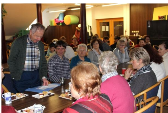
KČT Jindřichův Hradec