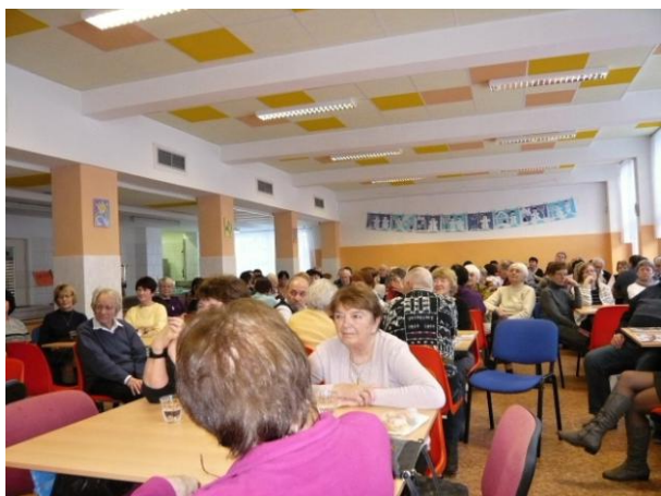
KČT Český Krumlov

V průběhu měsíců ledna a února 2017 probíhaly výroční členské schůze odborů KČT. Na těchto schůzích turisté hodnotili svoji činnost, plánovali akce na tento rok, bylo provedeno vyhodnocení neaktivnějších, předání vyznamenání, zvolili delegáty na krajskou konferenci KČT do Českých Budějovic. Na snímcích účastníci jednání členských schůzí v Českém Krumlově, Táboře a Jindřichově Hradci.