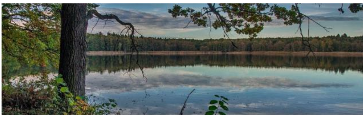
Rybník Černý Nadýmač