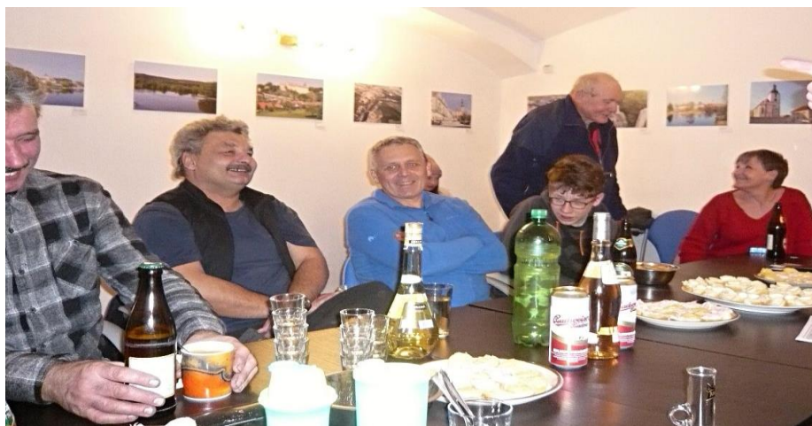
Fotografie z členských schůzí odborů