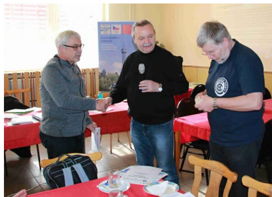
Fotografie z krajské konference